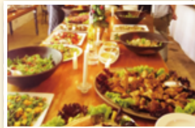
おいしい料理の数々

ケープタウンの街からワイン・ランドまでの道沿いには、バラック造りの小屋、裸電球の街灯が立ち並ぶ黒人居住地区(タウンシップ/Township: 政府によって分けられた住居地)をいくつも目にしました。アパートヘイト撤廃後は黒人が居住区外に住むことももちろん許可されていますが、今もなお人種ごとに住み