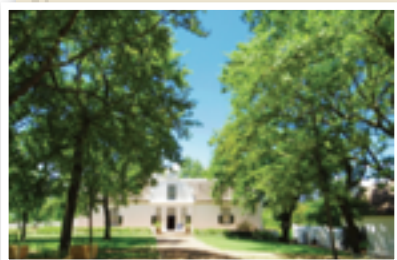
美しく整備されたワイナリー

南アフリカは世界でも有数のワイン名産地。ケープ地方はワインで有名な地中海気候に似ているため、ヨーロッパからの開拓者たちがワイン生産を進展させ、特に、フランスを追われたユグノー派新教徒たちが暮らし始めた17世紀末あたりから、生産技術が一気に高まったと言われていました。今では、南アフリカワインはコンテストでも賞を取るほどの実力。世界からもおいしいワインの生産地として認められています。