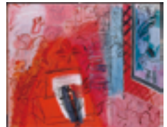
ラウル・デュフィ 《ヴァイオリンのある静物:バツハへのオマージュ》 1952年 油彩、カンヴァス パリ国立近代美術館、ボンビドゥール・センター

20世紀フランスが誇る色彩画家の本格的大回顧展! ラウル・デュフィ(1877-1953)は明るい色彩に軽快な筆さばりで、地中海のまばゆい光と開放的な風土、オーケストラや楽器など音楽を主題とした作品で日本でも大変人気の画家です。本展はよく知られた絵画作品をはじめ、木版画、テキスタイルデザインに至るまで、画家の全貌を紹介する大回顧展です。