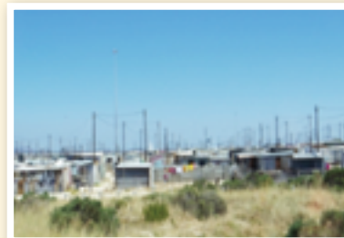
バラック小屋が立ち並ぶタウンシップ