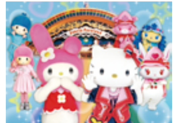
©'08-'14 SANRIO/SEGA TOYS. S-S/W-TX-JLPC ©'14 SANRIO APPROVAL No.P0503071

寒い日でも雨の日でも楽しく遊べるピューロランド。 優待パスポートを賢く利用してめいっぱい遊んでください。