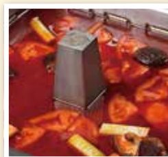
変わり種のトマト鍋