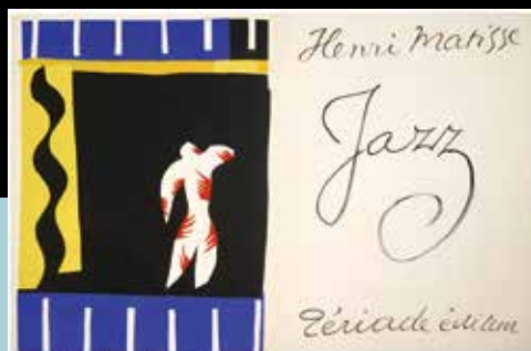
アンリ・マティス 《進化師》『ジャズ』 1947年刊

本展覧会では、ポーラ美術館のコレクションの中から挿絵本の黄金期にきらめく代表作をひもとく、初公開の挿絵を含む51点の挿絵本と、関連する絵画作品をご紹介します。めくるめく、「絵画」と「書物」の出逢いをご堪能ください。