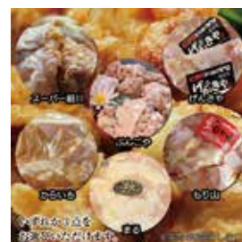
「中津からあげお好み3点お選びセット」