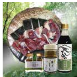
「耶馬のすっぽん鍋セット」