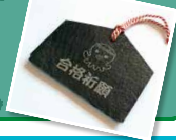
スレートde合格絵馬