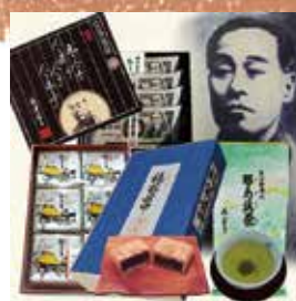
「学問のすすめセット」

福澤先生ゆかりの地、大分県中津市は豊かな自然に恵まれているほか、慶應カードニュースVol.31でもご紹介した「からあげの聖地」でもあります。寄附の用途は福祉対策、教育推進など5つから選ぶことができ、1万円以上の寄附を行った場合にはお礼の品が用意されています。その種類は28にも上り、「学問のすすめセット／福翁もなか1箱、諭吉の里1箱、一万円札の里2枚重ね4枚、耶馬溪茶・みどり1袋」をはじめ、人気のからあげ店の商品を詰め合わせた「中津からあげお好み3点お選びセット／ぶんどや、げんきや、からいち、もり山、スーパー細川、まる、より3点選択」、「耶馬のジビエセット／猪ロースライス、猪バラスライス、猪モモスライス、鹿肉ブロック」や「耶馬のすっぽん鍋セット／すっぽん生肉、かぼすポン酢しょうゆ、柚子こしょう、胡椒」のように野趣あふれるものもあります。