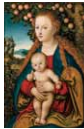
ルカス・クラナハ 《林檎の木の下の聖母子》 1530年頃

日時：3月18日(土)～6月18日(日) 10:00～20:00 (火曜日は17:00まで、但し5月2日は20:00まで)※入館は閉館の30分前まで 休館日：5月15日(月) 会場：森アーツセンターギャラリー (六本木ヒルズ森タワー52階) 価格：一般(当日) 1,600円▶1,350円 大学生(当日) 1,300円▶1,070円 中高生(当日) 800円▶580円 ※小学生以下入館無料