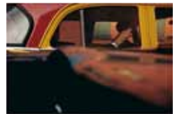
ソール・ライター《タクシー》1957年 ソール・ライター財団蔵

独・シュタイデル社が再発見した伝説の写真家、ライターの創造の秘密に迫る日本初回顧展!