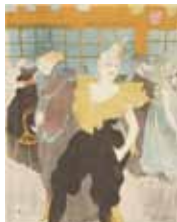
アンリ・ド・トゥールーズ=ロートレック《ムーラン・ルージュの女連立師》1897年、多色刷りリトグラフ、アムステルダム、ファン・ゴッホ美術館蔵

19世紀末パリ、ロートレックら前衛芸術家の実験的精神により、芸術と大衆文化の間で版画は発展した。約140点から版画の多様な広がりを見学する。