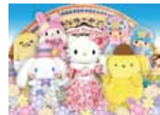
©13/17 SANRIO S/D-G ©76/90/96/01/17 SANRIO APPROVAL No.P0906131

寒い日でも雨の日でも楽しく遊べるサンリオピューロランド。優待パスポートを賢く利用してめいっぱい遊んでください。