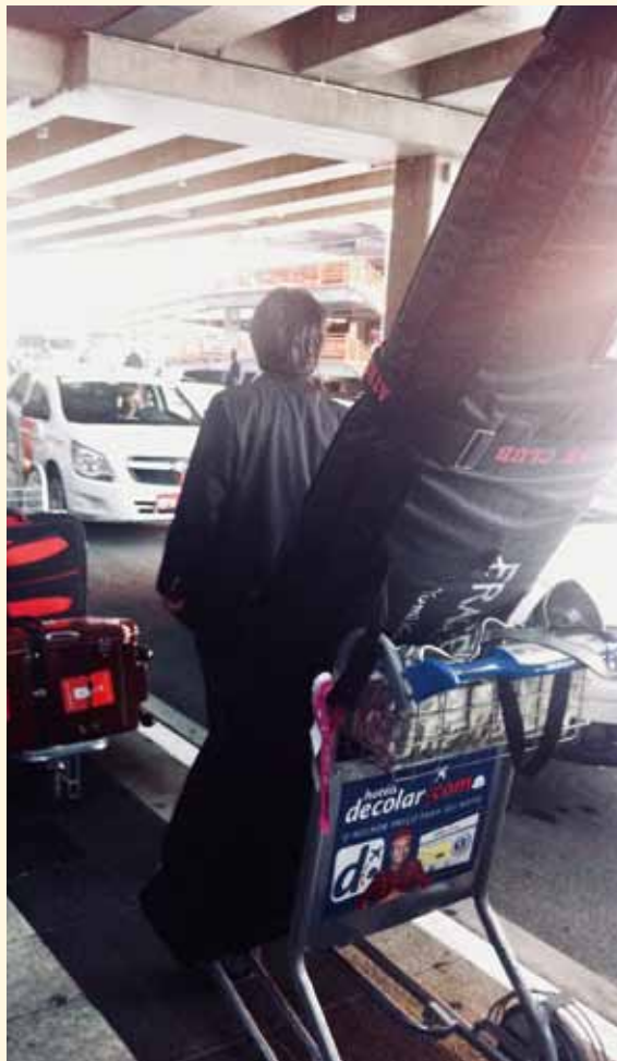
フライトケース（約190cm×50cm）と共に移動中

文化は、時間や土地を巡って交流し、色々に変化する。その土地によって言語、食文化、人種が違うが、それぞれに繋がりがあり、長い年月をかけて築き上げられた歴史は奥深い。それは各地を訪れる度に実感する。守るべき文化と、取って手放す文化の選択の瞬間が自分の中でも起こり得る。「日本人として」を捨てずに、グローバルなモラルの探索を続けること、これも私の人生でめざしたいゴールの一つだ。