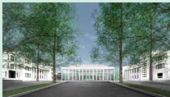
日吉記念館建て替え後の予想イメージ

在の6,500人から約1万人へと大幅に増え、アリーナ面積も拡大し体育施設としての充実も図られる予定です。建て替え前最後の三田祭前夜祭は11月4日（金）に行われ、木村カエラさんのコンサートで大いに盛り上がりました。