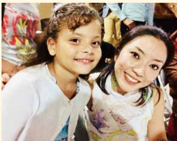
コンサート終了後のサイン会にて現地の女の子と（ドミニカ共和国）

見つからなかった。楽器行方知れずの際の先方のあまりのコメントと言い方の酷さに、一、二度声を荒げたことはあるが、何が起るかわからないので、できるだけ冷静でいること、これはだいぶこの15年で強化されたと自負している。