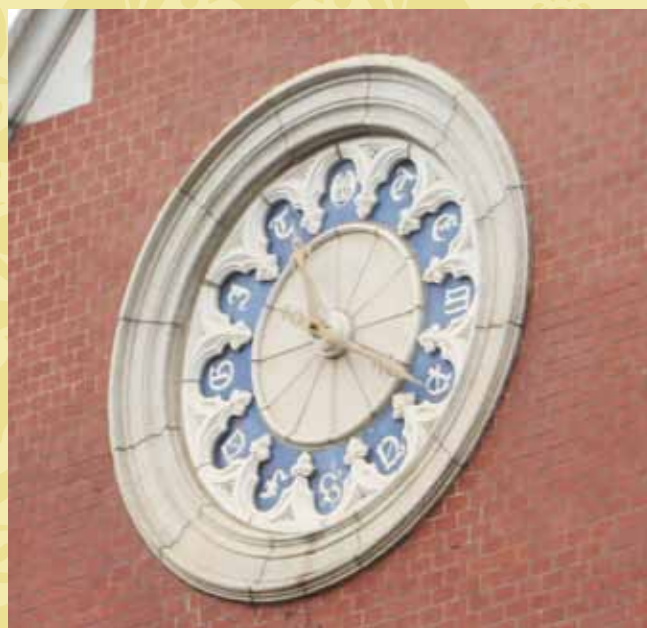
旧図書館の時計 文字盤には数字の代わりにラテン語で「光陰矢の如し」と書かれています。塾生の皆さん、勉学に励みましょう！

し、伝統を守りながら新たな時代へ踏み出そうとする慶應義塾の姿を象徴しているように感じられます。