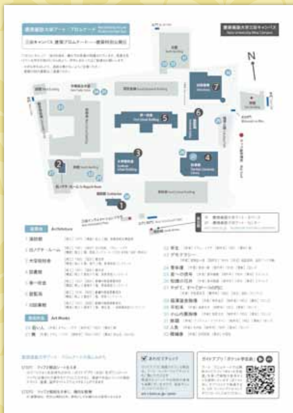
建築プロムナードのガイドマップ

塾生の皆さんはもちろん、塾員の皆さんにもきっと新たな発見があると思います。三田キャンパスに出向く機会がありましたら少し足を止めて、それぞれの建物を見学されてみてはいかがでしょうか。