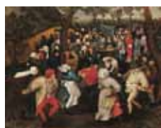
ピーテル・ブルーゲル2世 《野外での婚礼の踊り》 1610年頃 Private Collection

本展では通常見る 事が出来ない個人 所蔵の絵画など約 100点により構成さ れ、そのほとんどが 日本初出展となり ます。