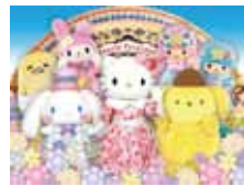
©13/17 SANRIO S/D-G ©76/90/96/01/17 SANRIO APPROVAL No.P0906131

寒い日でも雨の日でも楽しく遊べるサンリオ ピューロランド。優待パスポートを賢く利用し てめいっぱい遊んでください。