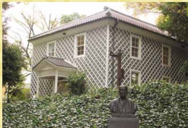
工事に伴い、演説館前に移動した福澤諭吉胸像。福澤先生がスピーチ＝演説やディベート＝討論と翻訳したことをご存じですか？

編集部が参加した18日は、時折雨がぱらつくあいにくの天候となりましたが、10:30からのツアーには老若男女20名以上が集まりました。演説館(内部見学)～塾監局(外観のみ)～旧図書館(外観のみ)～第一校舎(外観および一部教室)～図書館(外観のみ)～大学院棟(外観のみ)～旧ノグチ・ルーム(内部見学)に加え、点在する彫刻やキネティックアートの解説も交えた約90分のツアーです。集合場所付近の正門の左手、手前に見えるのがキャンパス内で一番新しいインフォメーションプラザ。その奥にたたずむ演説館は最古の建物ですが違和感なくマッチ